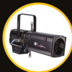
650SX DÉCOUPE LED