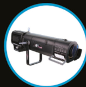
1156 POURSUITE LED