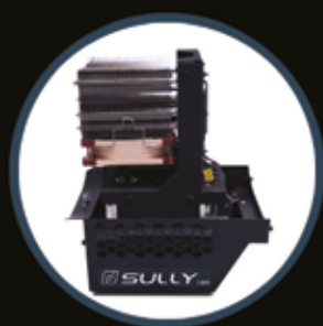
T/650SX RETROFIT LED