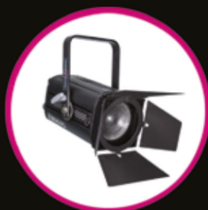
305LF / LPB FRESNEL OU PC LED